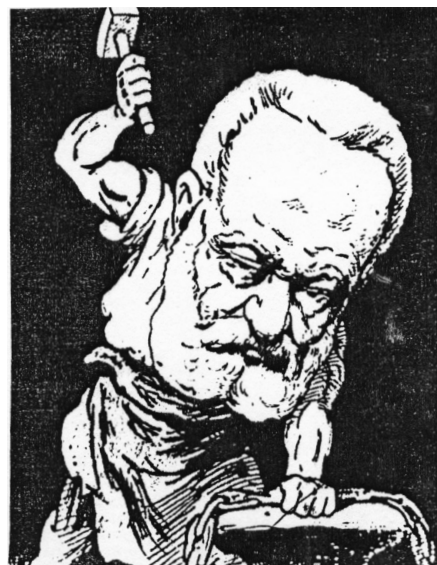
«Le vieux briseur de fers». (Dessin d'André Gill, 1879).

De même qu'il a abordé tous les genres littéraires, Victor Hugo prit part à toutes les luttes sociales pour les libertés. Il fut le militant passionné de tous les com-